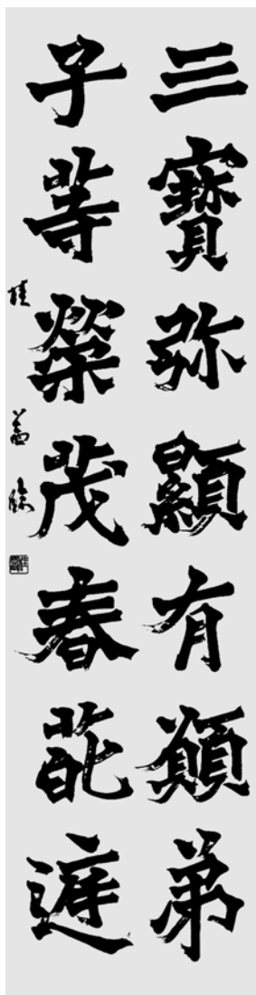
条幅随意（臨書）の部